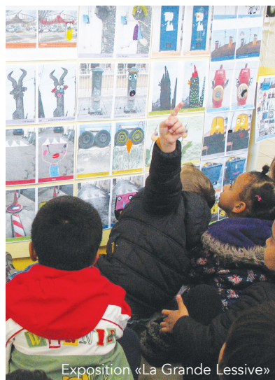
Exposition «La Grande Lessive»

Sur la page "Sortir à Celleneuve" de notre site internet : Les animations proposées dans le quartier tout au long de l'année.