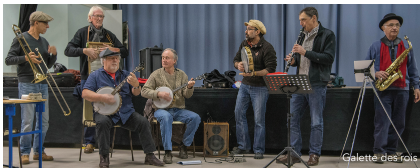
Galette des rois